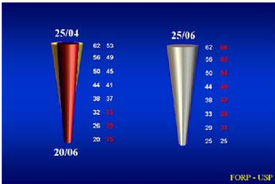
Figura 4. Numéro en rouge: c'est l'instrument qui va travailler.

Alors, sélectionnez les instruments qui vont promouvoir la préparation de la partie intermédiaire de canaux en évitant les tensions dans la région apicale, et ces instruments seront responsables pour l'aplanir les irrégularités et pour la formation conique proportionnelle et continue dans le canal radiculaire.