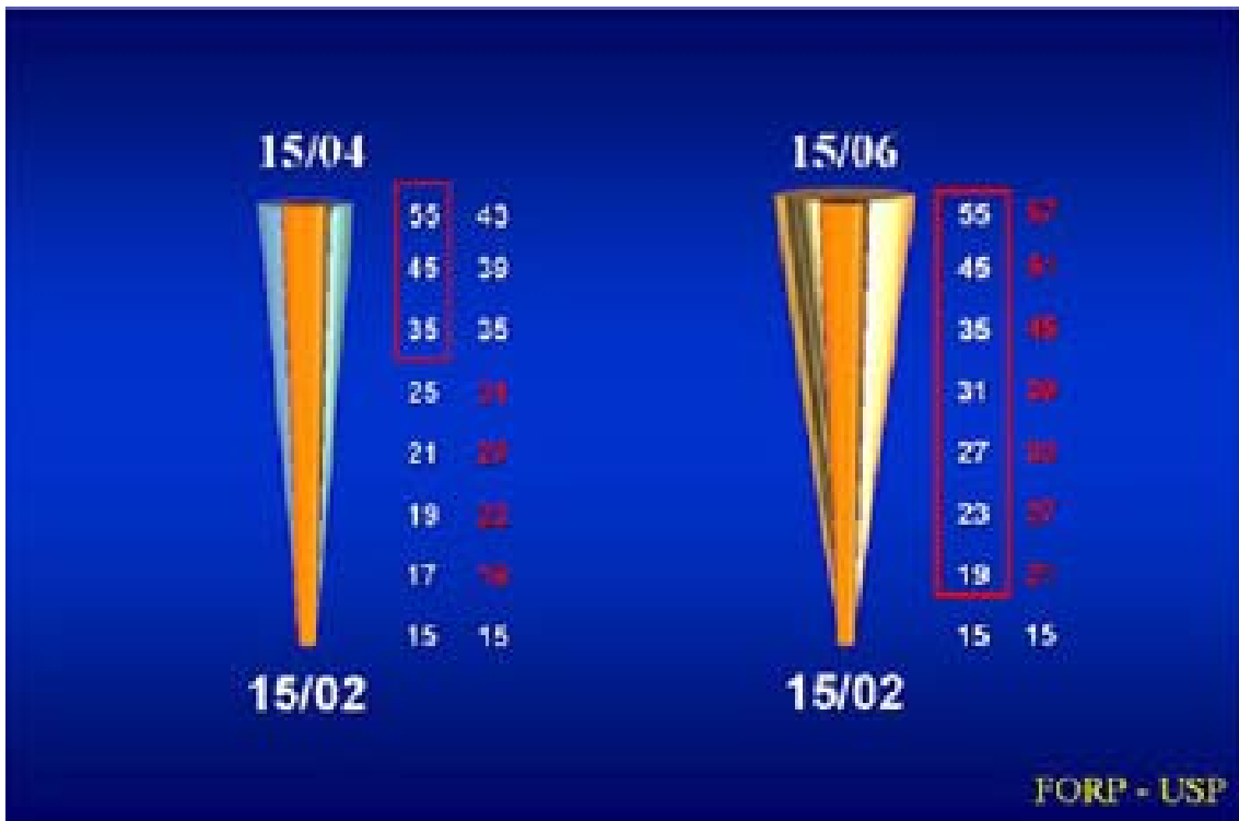
Figura 2. Numéro en rouge: c'est l'instrument qui va travailler.

L'area qui est demarquen rouge: c'est l'area qui l'instrument travailler et modifié les canaux.